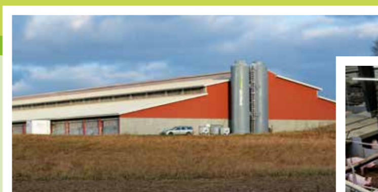
Intellifarm slagtesvinestald med Agri AirClean luftreenser.

Varmeslanger i det faste gulv giver grundvarmen i slagtesvinestalden, og ripperør ved facadevinduer giver rumvarme og sikrer luftindtag uden træk på grisene. Slagtesvin kvitterer for varme, bl.a. fordi varme sænker fugtigheden i stalden.