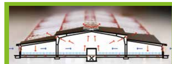
Du sparer simpelthen 8 ud af 10 ventilatorer væk.

Slagtesvinestalden er udstyret med hybrid ventilation. Hybridventilation kombinerer naturlig ventilation med et gulvudsug, og reducerer energiforbruget til ventilation markant.